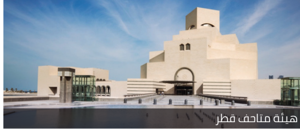
هيئة متاحف قطر