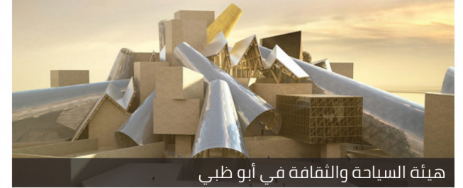
هيئة السياحة والثقافة في أبو ظبي