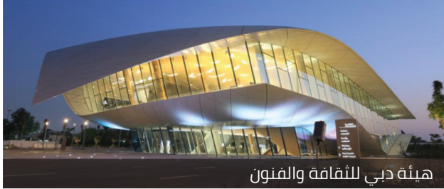
هيئة دبي للثقافة والفنون