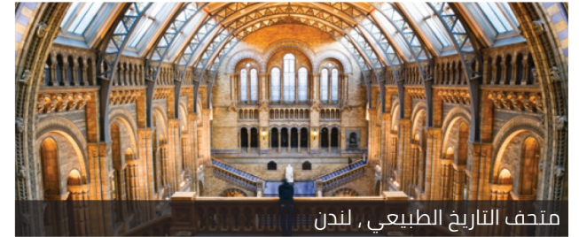
متحف التاريخ الطبيعي , لندن