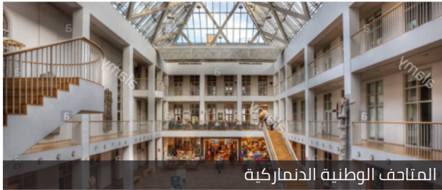
المتاحف الوطنية الدنماركية